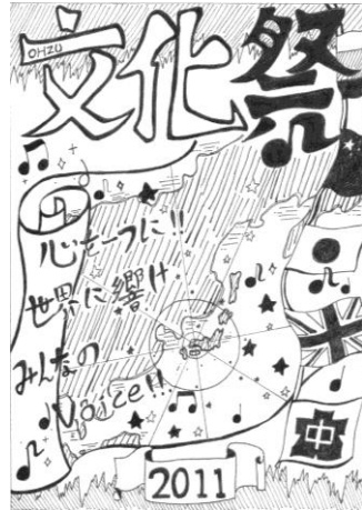
最優秀賞 2 E 東 雪乃