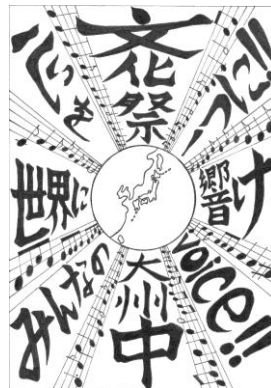
優秀賞 2 E 市谷 百繪