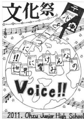
優秀賞 3 A 部村 直保